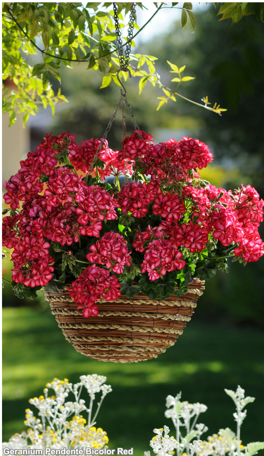
Geranium Pendente Bicolor Red

A série Gerânio Pendente apresenta cultivares rústicas de cores tropicais vibrantes. Possui tolerância ao calor e as altas temperaturas do verão. Com excelente desempenho em condições de clima mais ameno, é ideal para uso em varandas, canteiros ou espaços iluminados e abrigados. Pode ser cultivado em bandejas, potes ou cuias 13 a 25.