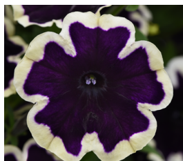
SureShot Blueberries & Cream