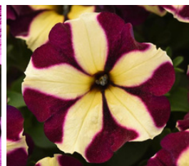
SureShot Raspberry Cheesecake