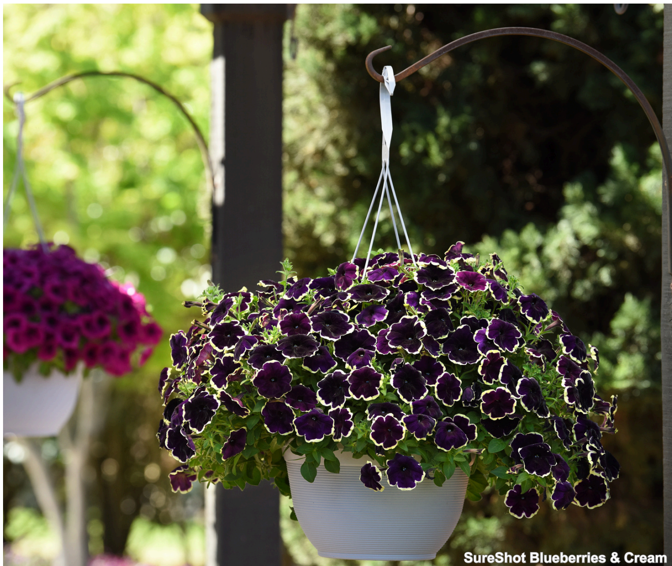
SureShot Blueberries & Cream

As Petunias da linha premium Garden Stars destacam-se pelo alto poder ornamental, cores vibrantes e excelente resistência ao clima tropical. As séries Sureshot e Famous Sky são ideais para cultivo em vasos, cuias pendentes, além de maciços e canteiros. Podem ser cultivadas em potes do tamanho 14 ao 30, bem como em cuias de variados tamanhos.