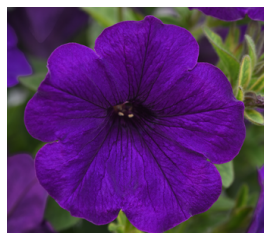
SureShot Dark Blue