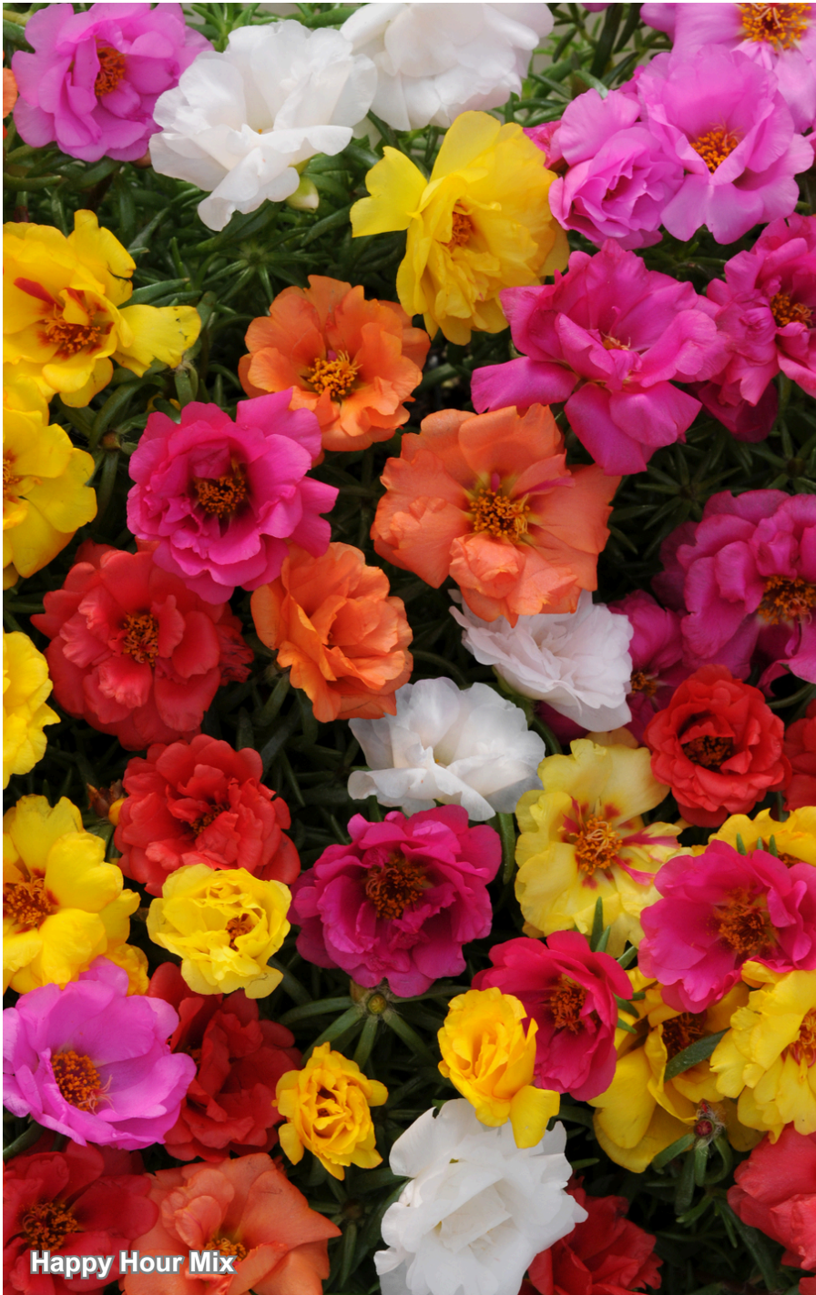
Happy Hour Mix

Variedade de Portulaca de porte compacto, com hábito de crescimento uniforme, formando um verdadeiro tapete colorido quando utilizada como forração em jardins. Apresenta flores grandes, semi-dobradas e de cores vibrantes, com excelente desempenho em condições de pleno sol, calor intenso e baixa disponibilidade hídrica.