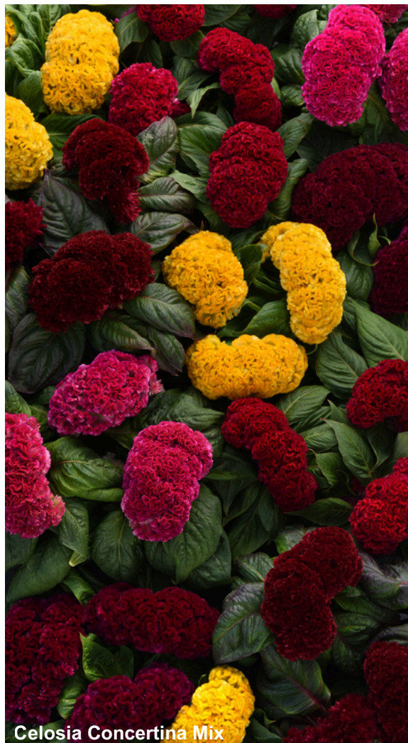
Celosia Concertina Mix