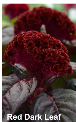
Red Dark Leaf