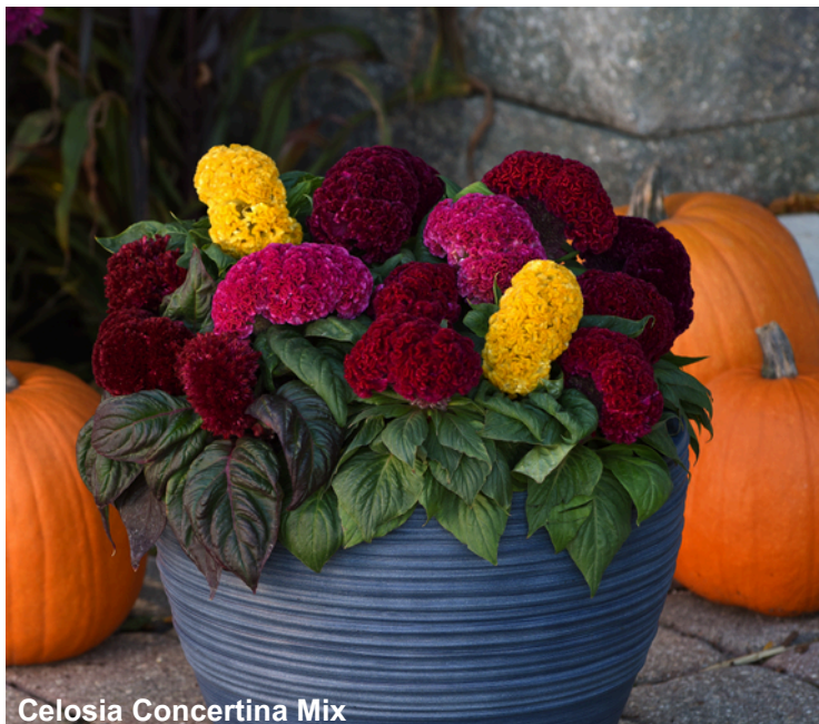
Celosia Concertina Mix

Com a mais ampla gama de cores do mercado e crescimento compacto e uniforme, a Celósia Concertina apresenta produtos diferenciados para espaços de pleno sol ou de boa iluminação. A Concertina é uma excelente opção para vasos e floreiras e também pode ser usada diretamente em canteiros de jardim.