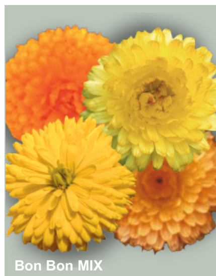
Bon Bon MIX

A propagação de cultivar protegida sem autorização é infração prevista na Lei de Proteção de Cultivares (Lei nº 9.456/97) sujeitando o infrator as penalidades legais.