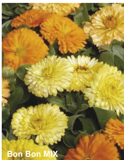
Bon Bon MIX