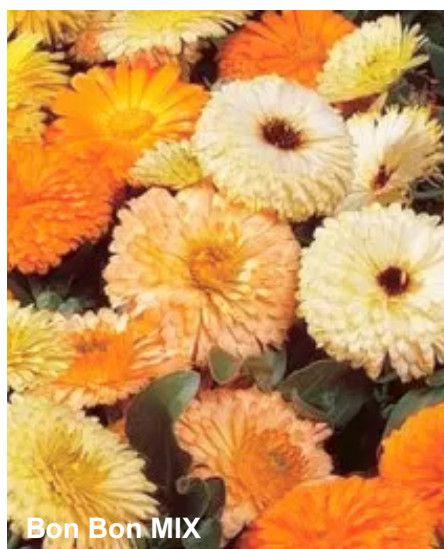
Bon Bon MIX