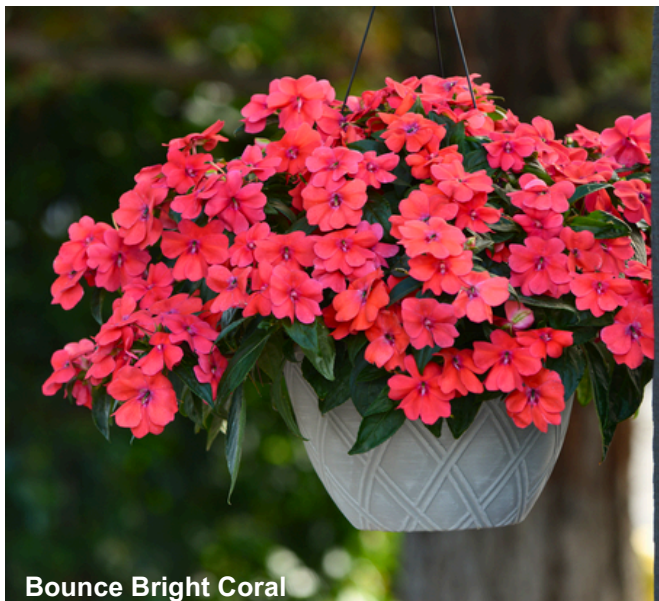
Bounce Bright Coral