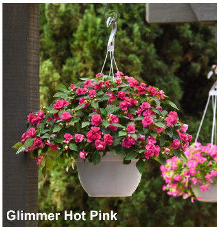
Glimmer Hot Pink

O Glimmer é o novo e surpreendente Impatiens dobrado que chega ao mercado. Destacando-se pelas flores dobradas e numerosas, suas 6 cores chamativas atraem a atenção de qualquer pessoa. Além de sua beleza única, é o primeiro Impatiens com elevada resistência ao míldio, trazendo mais eficiência ao produtor. Ideal para ambientes de meia sombra e bem iluminados, pode ser cultivado em potes do tamanho 11 ao 15 ou em cuias e floreiras do tamanho 21 a 26.