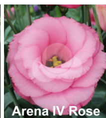
Arena IV Rose