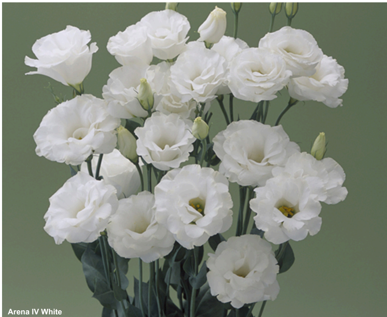
Arena IV White

O sortimento Ball conecta o produtor às melhores genéticas globais, aliadas ao vigor inigualável dos nossos plugs para garantir um início de cultivo superior. O Grupo 4 define-se pelo comportamento tardio e ciclo de 22 a 24 semanas, sendo a ferramenta indispensável para as janelas de transplante das semanas 01 a 03 e 45 a 52, onde o controle do desenvolvimento é crucial.