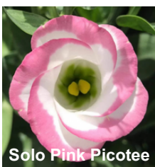
Solo Pink Picotee