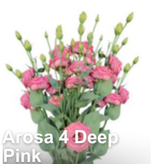
Arosa 4 Deep Pink