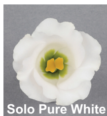
Solo Pure White