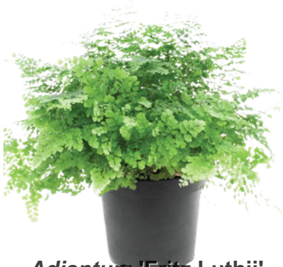
Adiantum 'Fritz Luthii'

O sortimento de samambaias da Ball reúne 20 espécies, incluindo Adiantum , Asplenium , Davallia , Hemionitis , Nephrolepis e Platycterium , com hábitos, cores, formatos e tamanhos variados. São ideais para jardins sombreados ou ambientes internos bem iluminados, vasos ou como plantas pendestes, proporcionando leveza, volume e um visual naturalmente elegante.