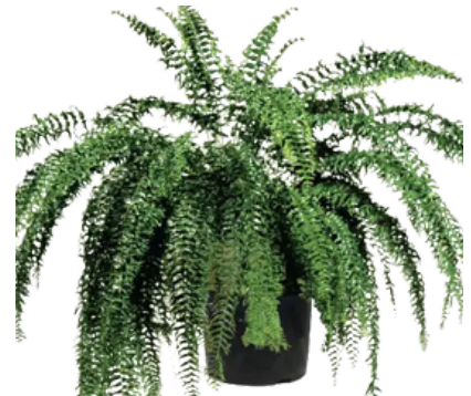
Nephrolepis 'Fish Tail'