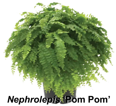
Nephrolepis 'Pom Pom'