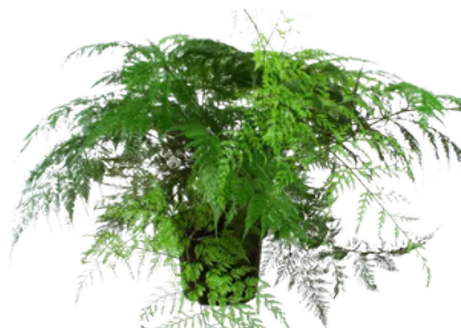
Davallia 'Hare's Foot Fern'