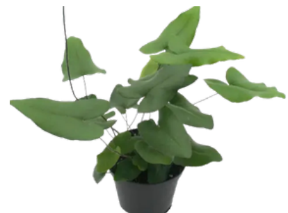
Hemionitis 'Heart Fern'

A propagação de cultivar protegida sem autorização é infração prevista na Lei de Proteção de Cultivares (Lei nº 9.456/97) sujeitando o infrator as penalidades legais.