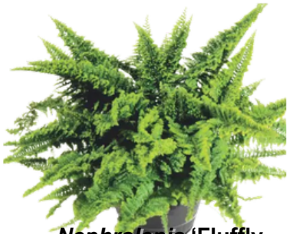
Nephrolepis 'Fluffy Ruffles'