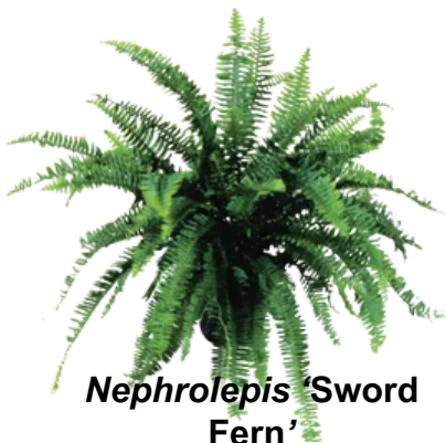
Nephrolepis 'Sword Fern'