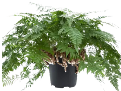
Davallia 'Rabbit Foot Fern'