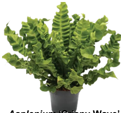
Asplenium 'Crispy Wave'