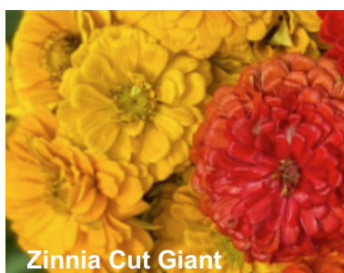
Zinnia Cut Giant