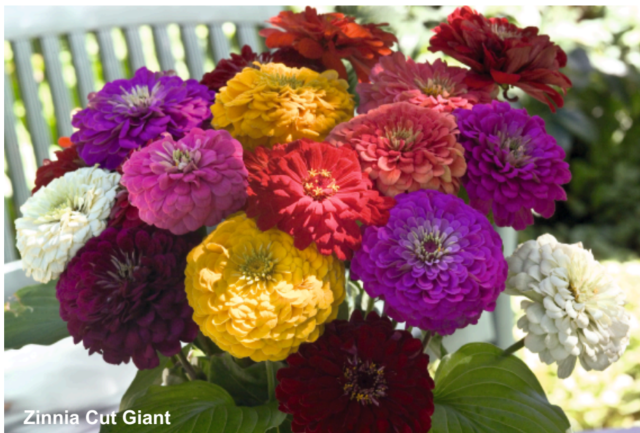
Zinnia Cut Giant